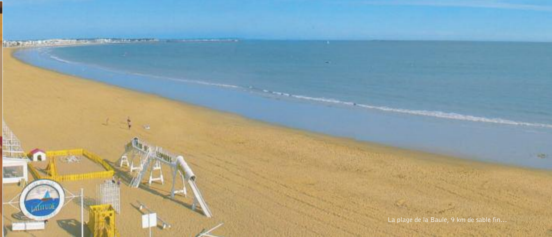
La plage de la Baule, 9 km de sable fin...